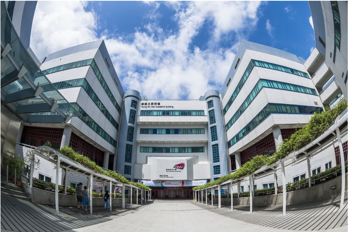
Image : l'entrée principale de l'université