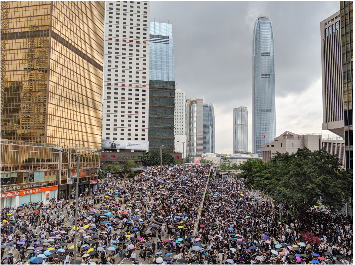
Image : Manifestations de 2019 à Central