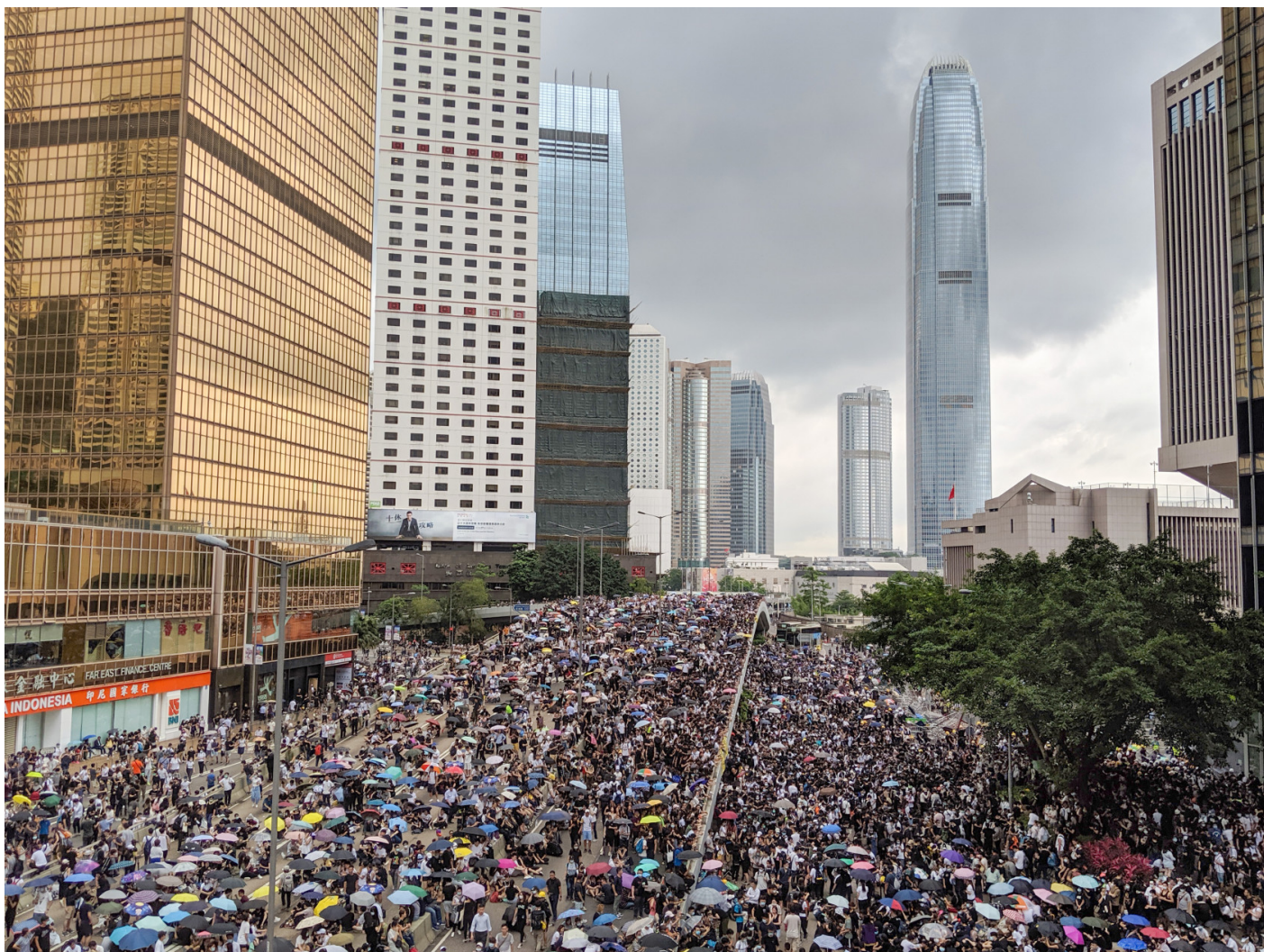
Image : Manifestations de 2019 à Central