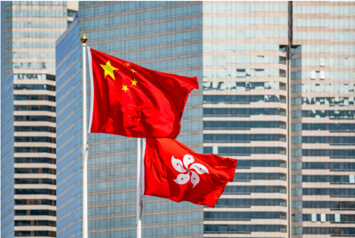
Image : Les drapeaux chinois et hongkongais

Hong Kong est donc rétrocédée à la Chine le 1er juillet 1997, et le principe "un pays, deux systèmes" doit rester en vigueur jusqu'en 2047. Hong Kong est donc officiellement la "Région Administrative Spéciale de Hong Kong de la République Populaire de Chine". Néanmoins, le principe "un pays, deux systèmes" est mis à rude épreuve à plusieurs reprises, ce qui entraîne des manifestations et émeutes importantes notamment en 2014 (révolution des parapluies) mais surtout en 2019-2020.