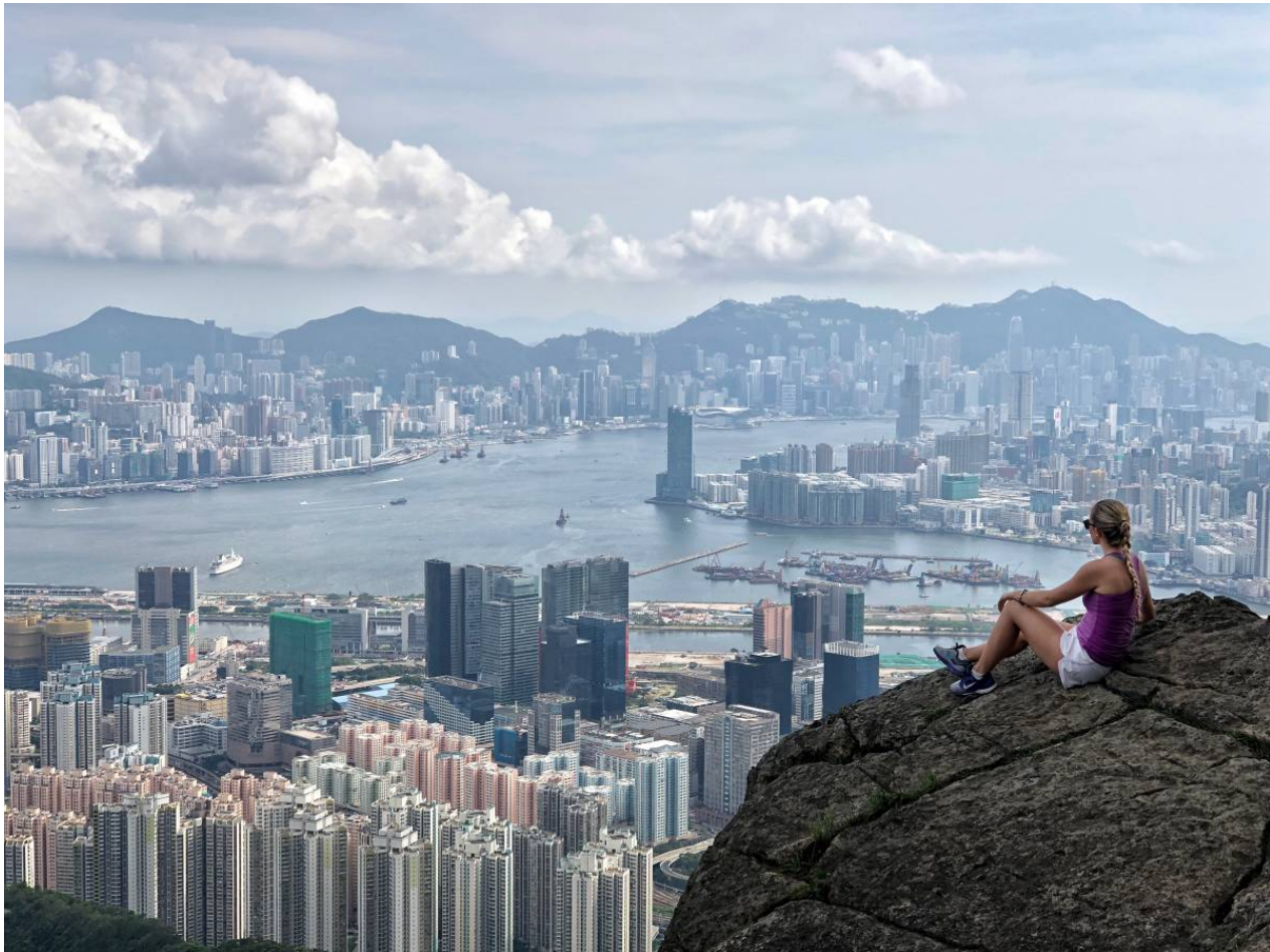
Image : Suicide cliff, un des sentiers de randonnée les plus connus de Hong Kong

Comme la plupart démarrent dans la ville, vous avez accès à énormément de parcours en métro ou bus à moins d'une heure des résidences. Pour ce qui est de la chaleur, début septembre il fait encore chaud et marcher sous 40 degrés n'est pas forcément la plus agréable des expériences. Mais à partir d'octobre, le temps devient plus que clément pour partir en excursion. Attention cependant à ne pas partir trop tard, le soleil se couche vite vers 18h (testé et pas approuvé). Pensez également à avoir des chaussures assez adhérentes, les sentiers humides peuvent être glissants (notamment après les pluies).