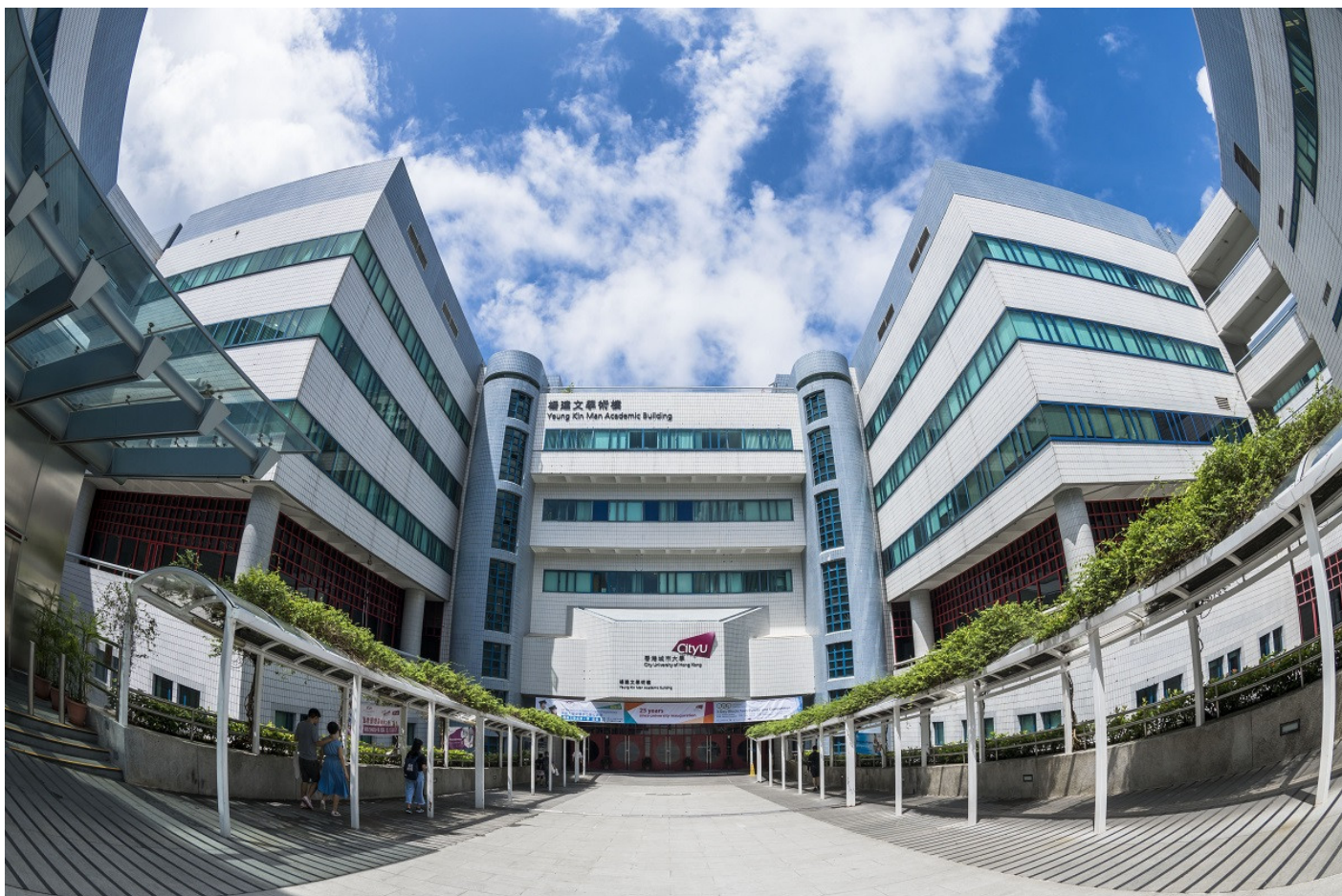
Image : l'entrée principale de l'université

Votre cher serviteur vous écrit ces mots depuis le superbe complexe de la résidence de Ma On Shan, dont il a eu l'honneur d'en être parmi les premiers occupants. En effet, la résidence a ouvert en septembre 2024 et accueille la quasi totalité des étudiants d'échange. Exit les galères de logement et autres options onéreuses : il est vivement recommandé d'opter pour cette résidence.